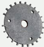
Sincronizacion Rueda Disparadora