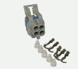
Kits Conectores de Oxígeno Sensores