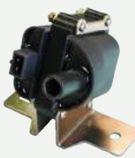
Bobinas de Encendido