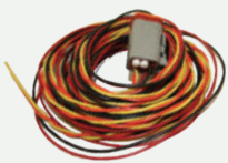
Arnés de Cable