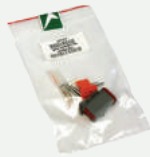
Conector de Acoplamiento