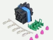
Kit Conectores de Varios componentes