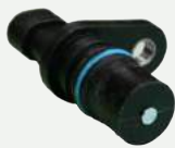
Sensores de Posicion del Motor